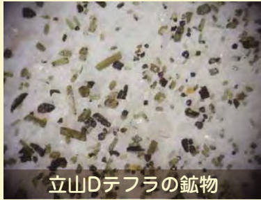
立山Dテフラの鉱物

また、北アルプス以外の遠来（鹿児島県や鳥取県などから）の“広域火山灰”についても実物とともに展示・解説します。