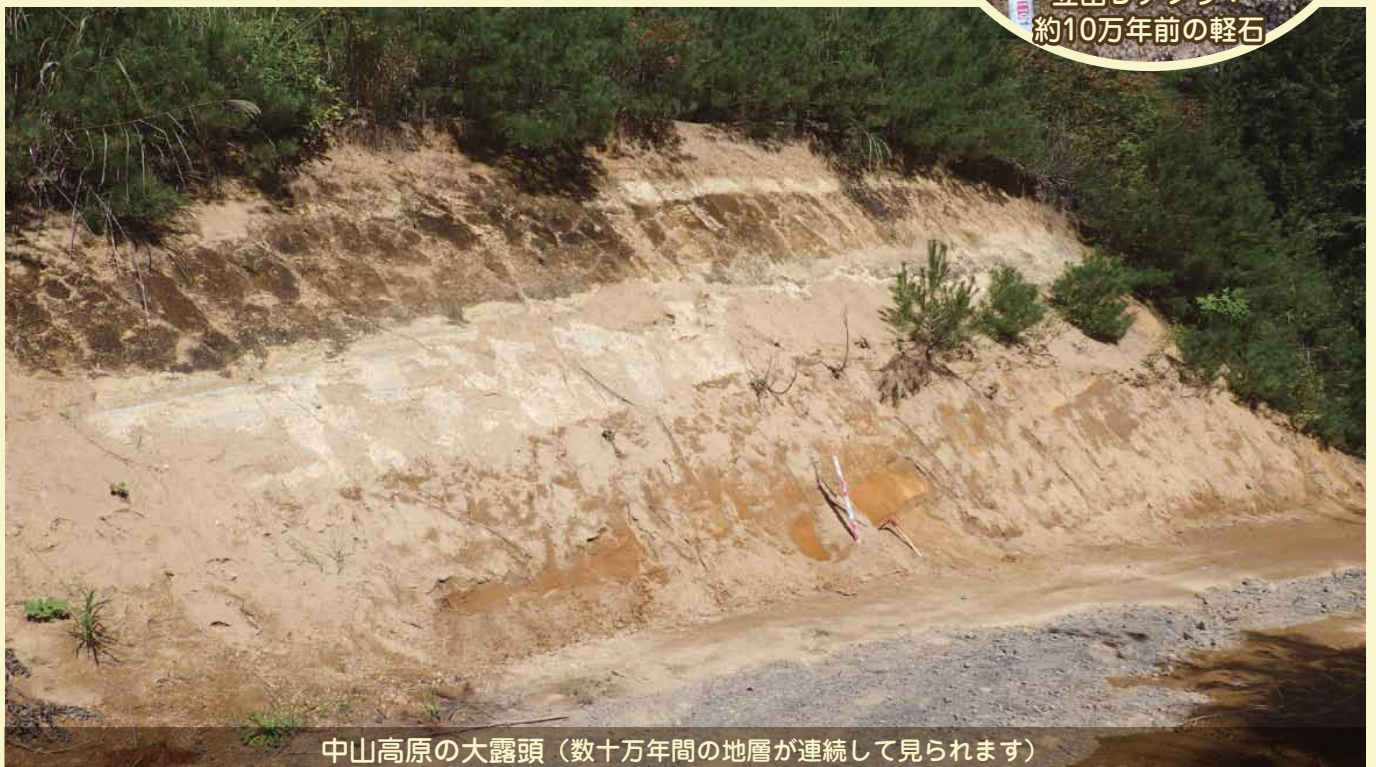
中山高原の大露頭(数十万年間の地層が連続して見られます)