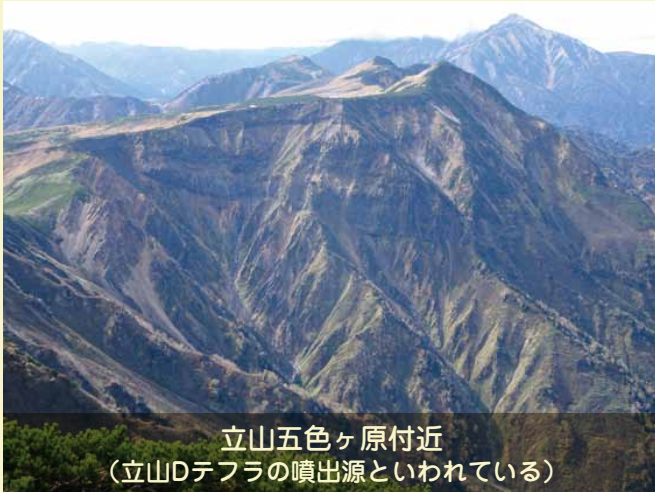
立山五色ヶ原付近 (立山Dテフラの噴出源といわれている)

大町に降った火山灰の噴出源を求めて訪れた現在の立山火山のようすを写真で紹介し、過去の研究成果からわかっていることについて解説します。