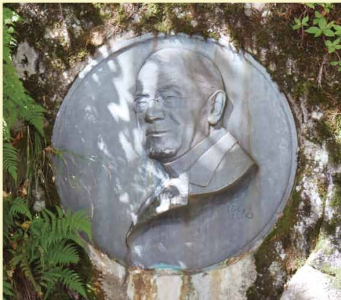
ウェストン レリーフ 上高地 ウェストン園地

英国人宣教師ウォルター・ウェストンの功績を称え、上高地の河童橋近くの岩壁には、その横顔をかたどった鋼製レリーフが埋め込まれています。現在、上高地散策の見所のひとつとなっているこのレリーフですが、戦時中の一時期、取り外されたことがありました。