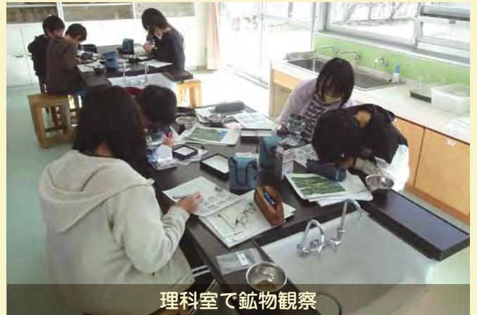
理科室で鉱物観察

ぜひ、この機会に太古の昔の火山活動のようすを直接目で見て、手で触れて、感じて（においもするかも？）……体感しにお越しください。