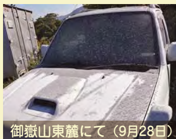
御嶽山東麓にて（9月28日）

長野県内および周辺地域で現在活動中の活火山について紹介します。2014年の御嶽山噴火時の周辺の写真や実物の火山灰をご覧ください。