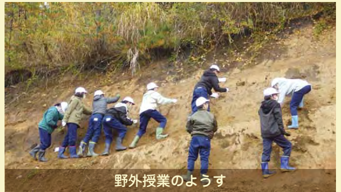
野外授業のようす