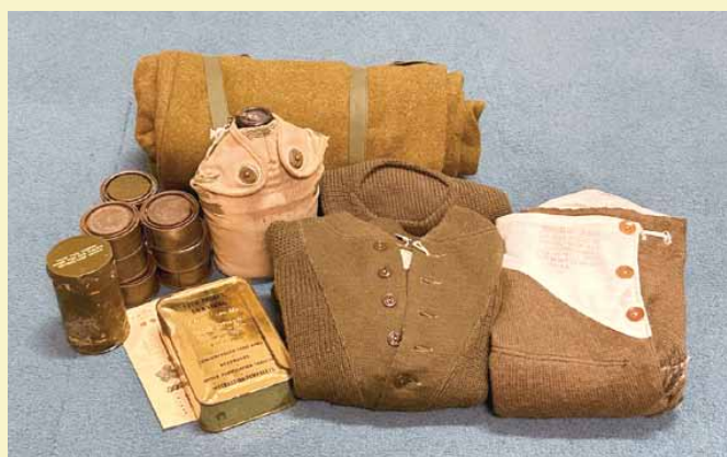
登山で使用された米軍放出品