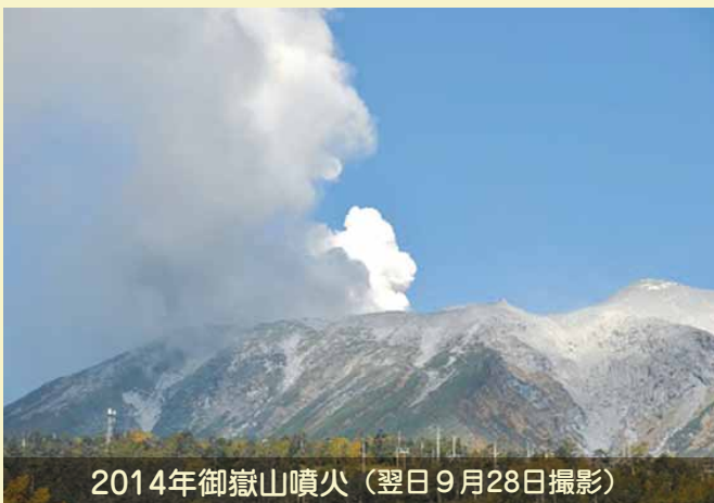
2014年御嶽山噴火（翌日9月28日撮影）

長野県内および周辺地域で現在活動中の活火山について紹介します。2014年の御嶽山噴火時の周辺の写真や実物の火山灰をご覧ください。