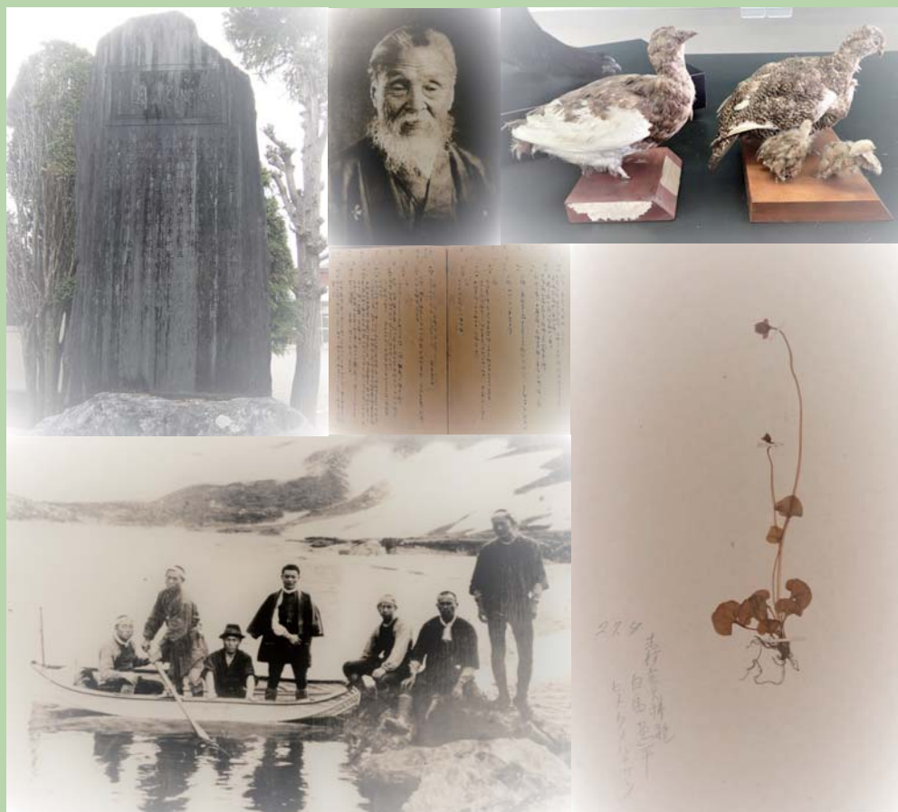
写真：〈上部左端から右回りに〉渡邊敏記念碑、渡邊敏肖像【大町市立大町西小学校蔵】、ライチョウ剥製【大町市立美麻小中学校蔵】、志村寛採集の植物腊葉標本【当館蔵】、田中阿歌麿による白馬大池での湖沼調査風景 1920（大正9）年【当館蔵】 〈中央〉窪田畔夫筆「郡治日録」1883（明治16）年 写し【一般社団法人北安曇教育会蔵】