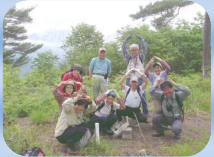
三角点現地見学会

「山岳」をキーワードにして、残された資料をもとに山岳文化をみんなで読み解き学ぶ会です。また実際に自分の目で確認し検証するため、見学会や調査など随時開催致します。