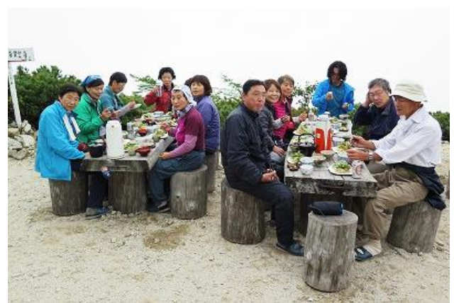
船窪小屋のいつもの大ご馳走に舌鼓を打つ仲間達