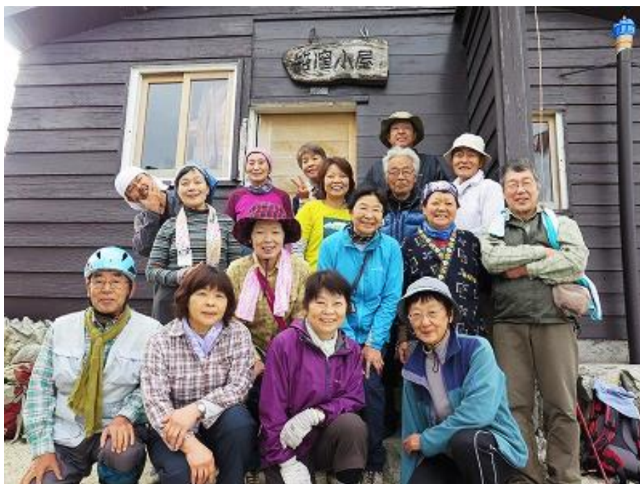
父さん母さんを囲んで出発前のさわやかな笑顔