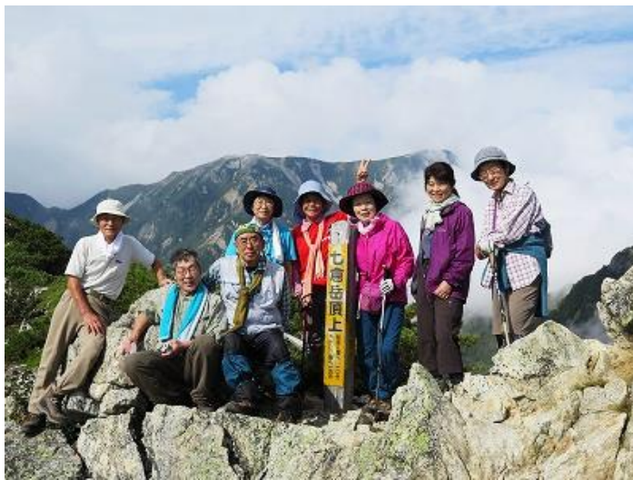
七倉岳頂上を極めた有志達

くつろぐ人、足の痛みを治療する人等別れたが、有志のみで七倉岳(2509m)を目指した。その帰りに水場に立ち寄り本日の水の確保。 16時30分より外の新鮮な空気を吸いながらの気持ち良い夕食、少しくつろいだ後、18時40分より、ご夫妻への80歳記念表彰状および記念品の贈呈式が催された。