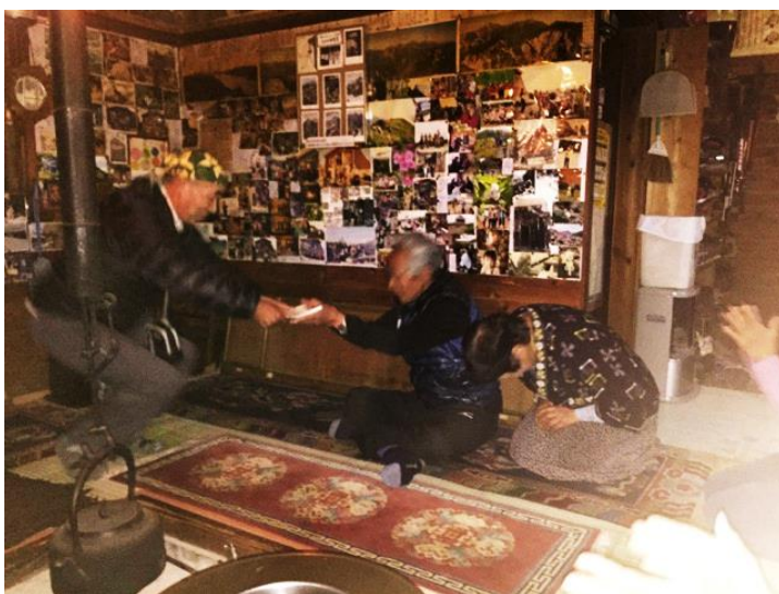
M ご夫妻への表彰状授与式