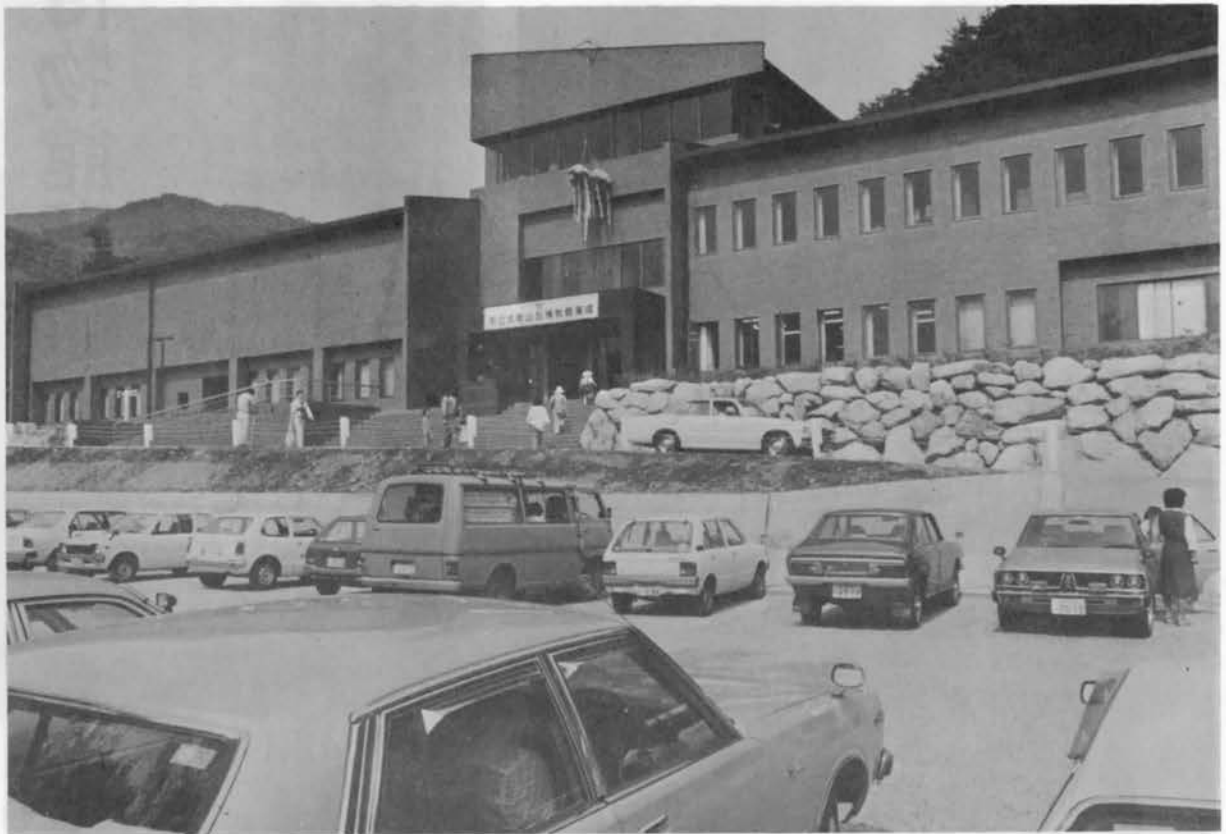
落成式当日の博物館