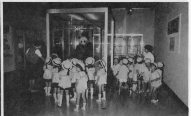
開館企画展「山岳博物館の歩み展」のジャイアントパンダ「カンカン」