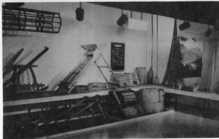
2階展示室—民俗コーナー

展示室の各コーナーごとに、展示物あるはその展示をより詳しく解説した「情報シート」が設置されています。 この情報シートは図表、写真などが入り、希望者にはコピーサービスを行っています。シートの左上の情報シートナンバーで受付に申しつけて下さい。