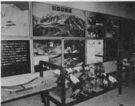
1階展示室 山岳の自然「ライチョウ」「カモシカ」コーナー