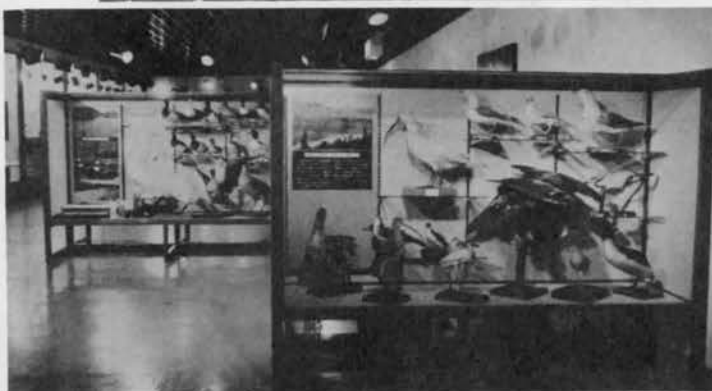
2階展示室—自然コーナー